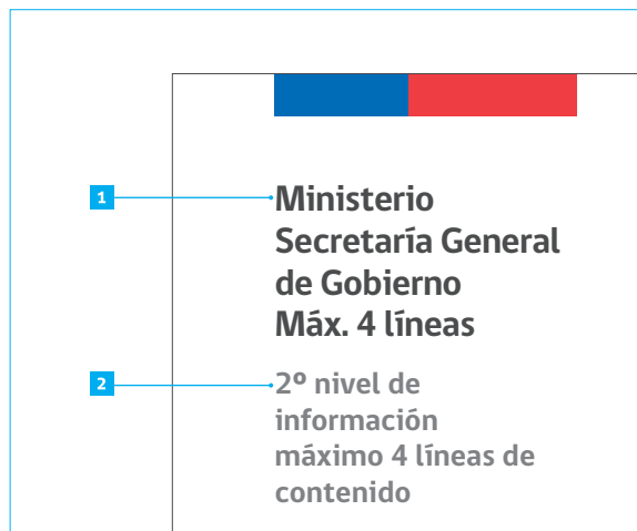
Fig.1 Acercamiento hoja carta. Esquina superior izquierda

tamaño: 10,5 pt interlineado: 12,3 pt color: negro CMYK al 60%