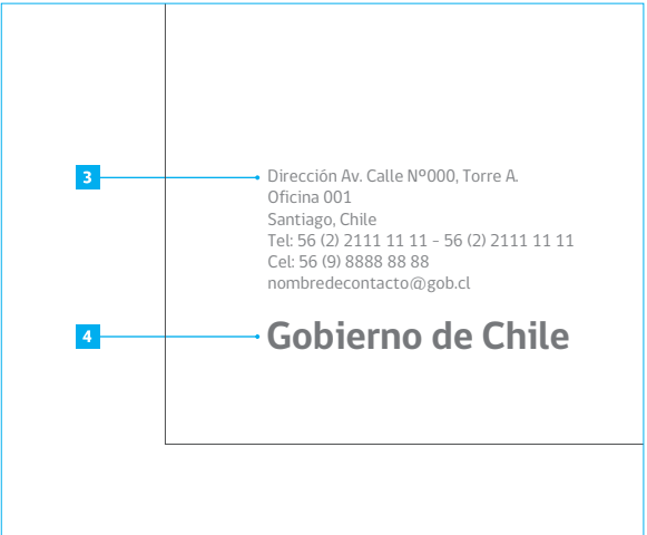
Fig 2. Acercamiento sobre. Esquina inferior izquierda

4 Sello de Gobierno gobCl Bold tamaño: 13.5 pt color: negro CMYK al 65%